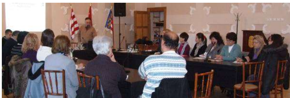
A Városházán bemutattuk eddigi munkánkat és megvitatott terveinket a polgármesterrel, önkormányzati képviselőkkel, a helyi intézmények és szervezetek vezetőivel

A szakasz zárásaként 2012 decemberében ismét szakma- és intézményközi fórumot tartottunk az eddigi tapasztalatainkról és ismertettük elképzeléseinket, melyet a Svájci–Magyar Civil Alap pályázati felhívására nyújtottunk be.