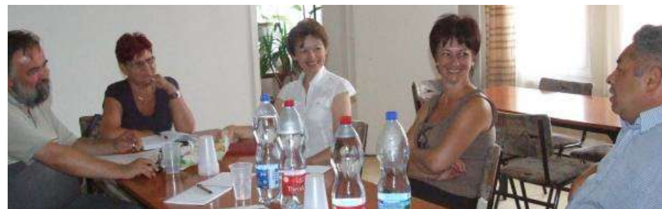
Közösségi beszélgetés a Civil Kerekasztal képviselőivel

hogy végül az önkormányzat az intézmények illetve a hozzá közel álló civil szervezetek segítségével Káposztás Napok néven mégis megrendezett egy hasonló rendezvényt, immár a CK szervezetei nélkül.