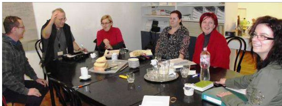
A Svájci–Magyar Civil Alap által támogatott programunk szakmai vezetőinek első megbeszélése

Az interjúk és a település megismerése alapján a Svájci–Magyar Civil Alap 5 pályázatára több szakmai megbeszélés 6 után az a következő tervet készítettük el.